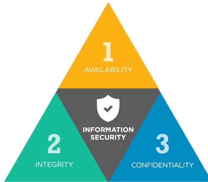
(The AIC Triad)